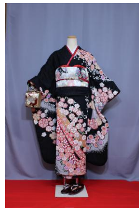
いっこう (くろA) IKKO (黒A)