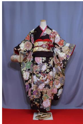
はるゆきわ 春雪輪