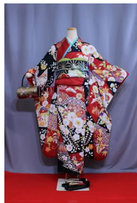
つじがはな (あか) 辻が花 (赤)