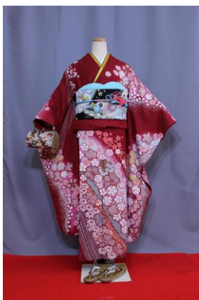
いっこう (あかA) IKKO (赤A)