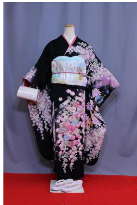
いっこう (くろB) IKKO (黒B)