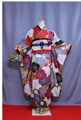
(あか) にこるん (赤)

振袖にはぞうり・バックがセットで 付いておりますが、 サイズが大きい方、小さい方には2 LサイズやSサイズに変更するこ とができます。 但し数に限りがございますのでお問 合せ下さい。