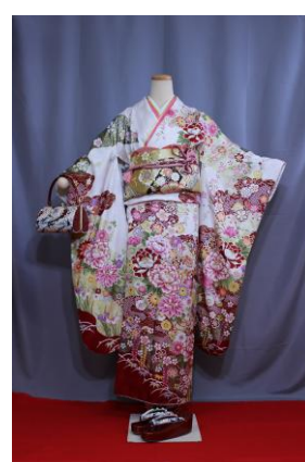
ゆめ 夢 (Sサイズ) (身長 145~155 cmの方)