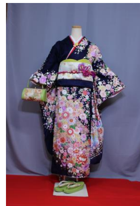
るり 瑠璃 (身幅Lサイズ)