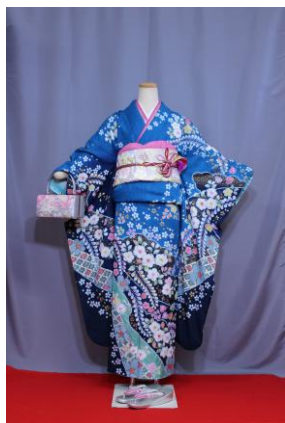
つじがはな（あお） 辻が花（青）