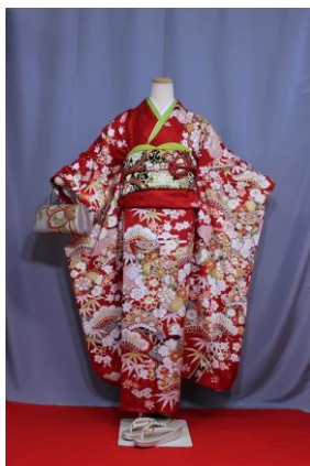
こうひ 紅妃（身幅Fサイズ）