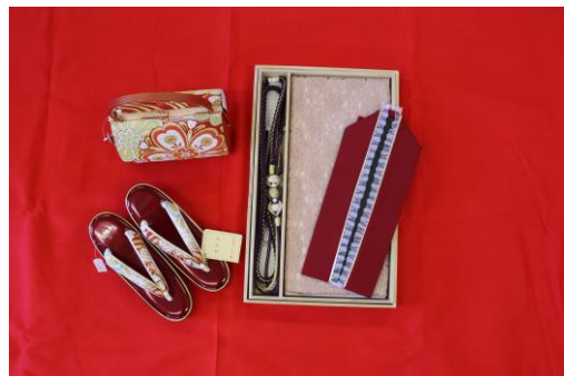
（小物② 3点・そうりバッグ）