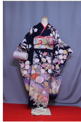
いっこう (こん) IKKO (紺)