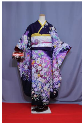
つじがはな (むらさき) 辻が花 (紫)