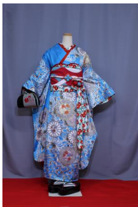
きょうまいこ 京舞妓