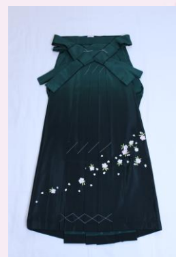
緑 ｶ B