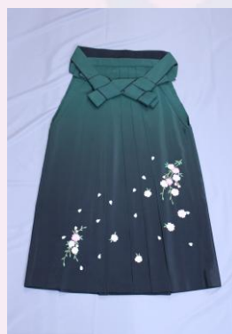
緑 ｶ A