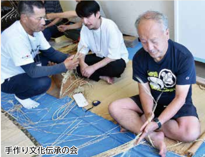
手作り文化伝承の会