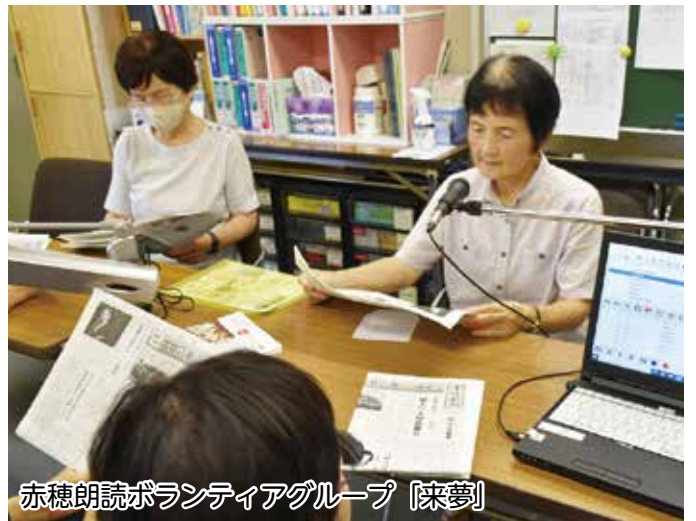
赤穂朗読ボランティアグループ「来夢」