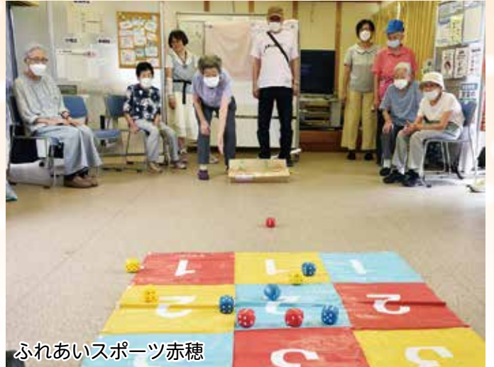
ふれあいスポーツ赤穂