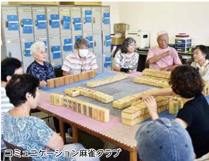
コミュニケーション麻雀クラブ