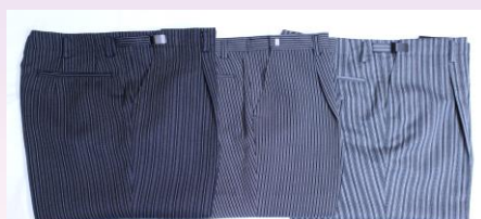
冬用 夏用 オールシーズン