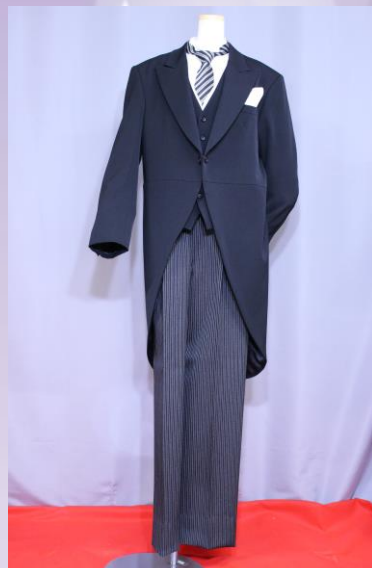
ノーマルタイプ (冬用・夏用)