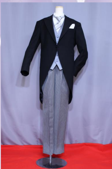
スマートタイプ (オールシーズン)