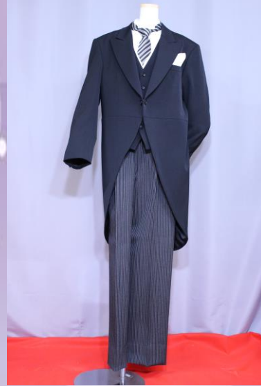
ノーマルタイプ (冬用・夏用)