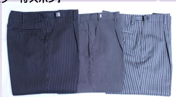
冬用 夏用 オールシーズン