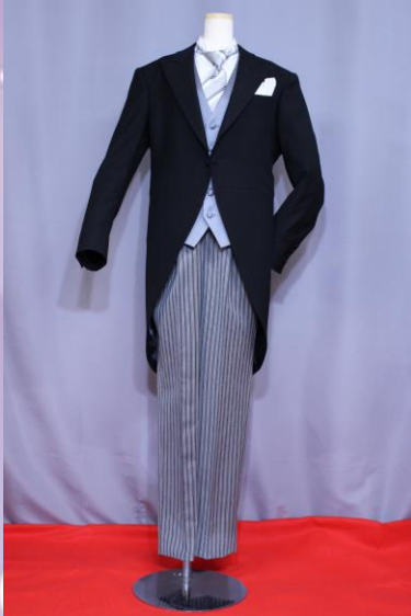
スマートタイプ (オールシーズン)