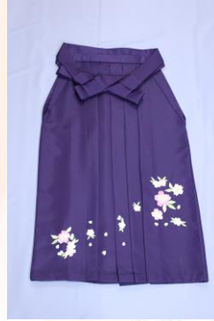
紫ワイド`M (適応身長 153~160cm) (袴下丈 91cm)