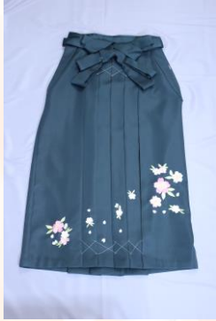
緑ワイド`L (適応身長160~170cm) (袴下丈 95cm)