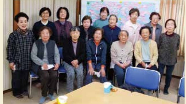
大橋町幸生会いきいきサロン

平成5年からボランティア活動に取り組み、高齢者施設への訪問を始めました。平成30年4月には、ボランティアグループ「山びこ」を設立し、代表として中心になって活動しています。コロナ禍では、施設訪問ができませんでしたが、折り紙作品や手作りマスクを届けるなど、つながり続けることを大切にしてきました。