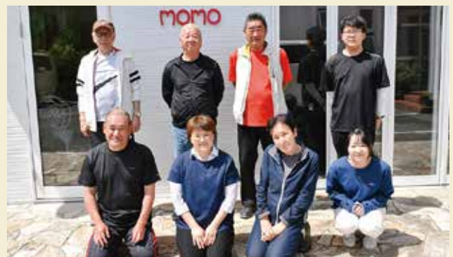
ふれあいスポーツ赤穂

グラウンドゴルフではホールインワン賞を設けることで励みと楽しみにつなげるなど、和気あいあいと、コミュニケーションを図っています。