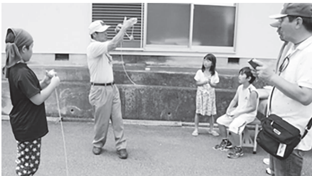
おっちゃん、コマ回しうまいなあ…