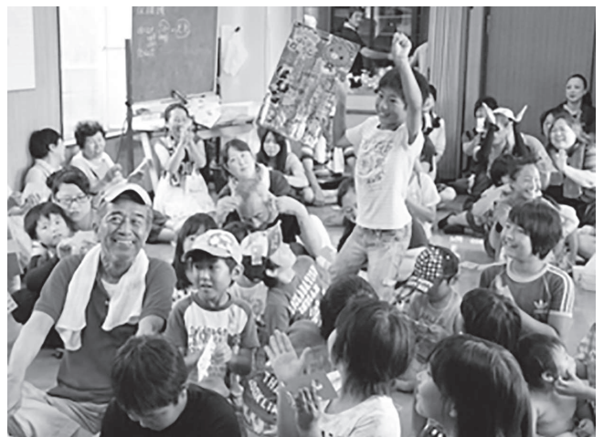
交流会の最後は、ビンゴ大会で大盛り上がり