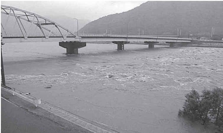
今年の台風11号によって増水した千種川 (7/17 高雄橋の様子)

近年、気候変動による異常気象が多発しており、災害から私たちの生命や暮らしを守るため、地域防災力を高めていくことが求められています。 個人でできること、地域でできることの一部をご紹介します。