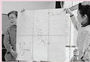
↑まずはマップ等を作成し、地域を知るところから始まります。

市内11自治会をモデル指定し、月1回程度の会合で、それぞれの地区の実態にあわせたシステム作りが話し合われています。