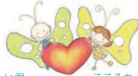
ぜんい君 こころちゃん 赤穂市善意銀行マスコットキャラクター