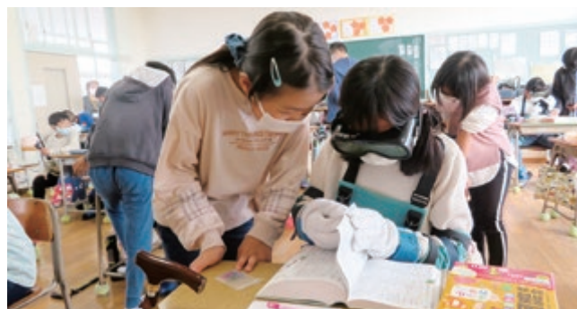
福祉協力校育成事業 高齢者疑似体験