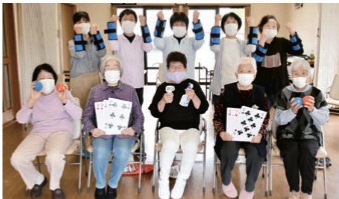
ふれあい・いきいきサロン

10月1日より赤い羽根共同募金が始まりました。コロナ禍の今、人とつながることが困難な時期であるからこそ、たすけあいの輪を広げるために、共同募金は重要な役割を果たしています。