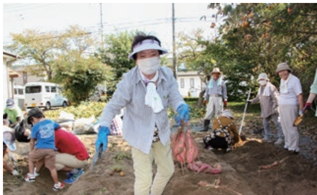
パートナーサービス