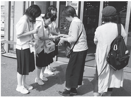
赤穂中学校 (イオン赤穂店)