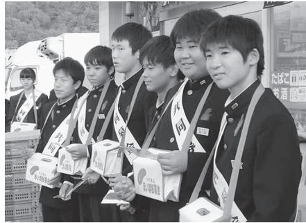
有年中学校 (ファミリーマート赤穂ちくさ川店)