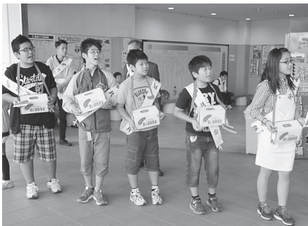
赤穂小学校 (JR 播州赤穂駅)