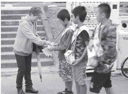
赤穂西小学校 (JR 天和駅)