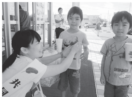
関西福祉大学実習生