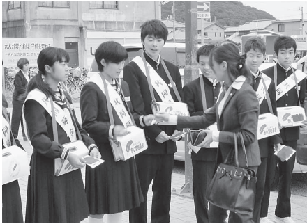
坂越中学校 (JR坂越駅)