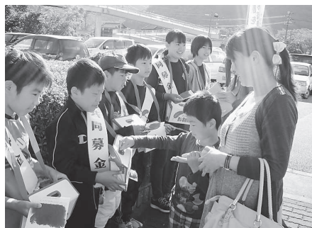
有年小学校 (有年ふるさとまつり)