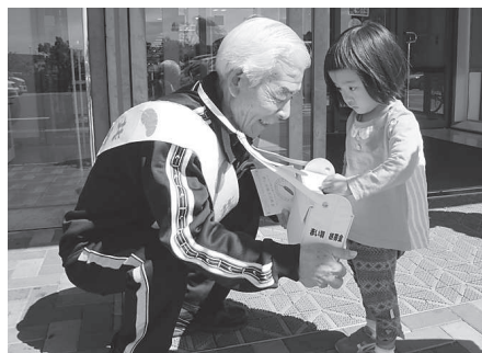
民生委員児童委員