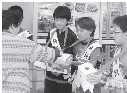
御崎小学校 (主婦の店尾崎店)