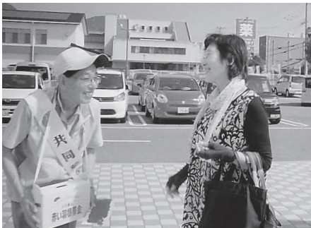
介護者の会 (主婦の店赤穂店)