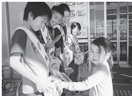
尾崎小学校 (主婦の店尾崎店)