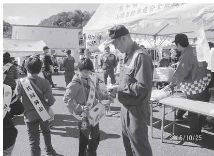
高雄小学校 (高雄ふるさとまつり)