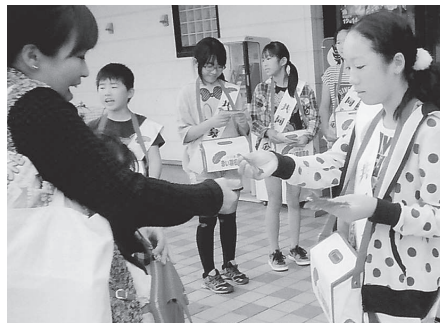
塩屋小学校 (主婦の店塩屋店)