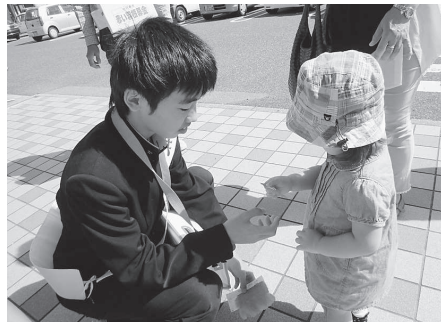
赤穂西中学校 (主婦の店塩屋店)