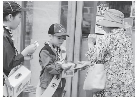
ボーイスカウト (イオン赤穂店)