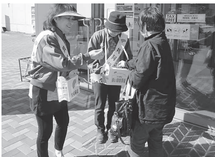
てんとうむし (イオン赤穂店)