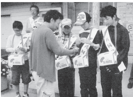
原小学校 (JR 有年駅)