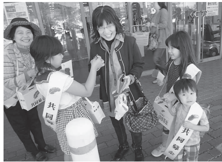
ボランティア協会 (イオン赤穂店)