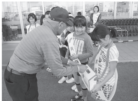
城西小学校 (ラ・ムー赤穂店)