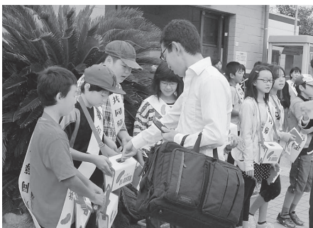
坂越小学校 (JR 坂越駅)