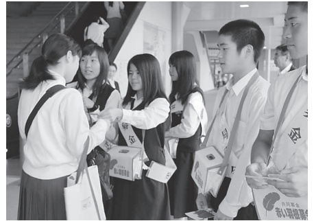
赤穂高等学校 (JR播州赤穂駅)