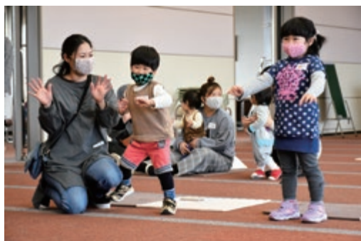
おもちゃライブラリー（親子イベント）