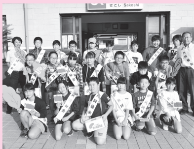
坂越小学校 (JR坂越駅)