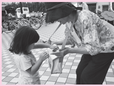
赤穂市介護者の会 (主婦の店赤穂店)