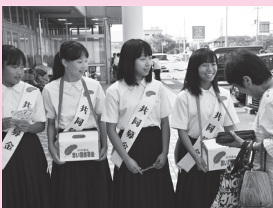
赤穂東中学校 (主婦の店尾崎店)