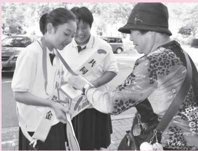
赤穂中学校 (イオン赤穂店)