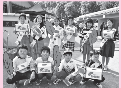
城西小学校 (ふれあいまつり)