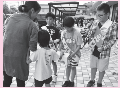
赤穂小学校 (主婦の店赤穂店)