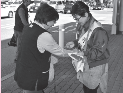
てんとうむし (イオン赤穂店)