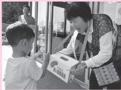
赤穂ボランティア協会 (イオン赤穂店)