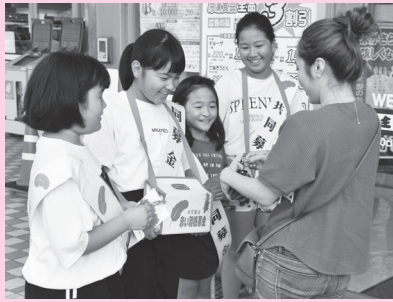
尾崎小学校 (主婦の店尾崎店)