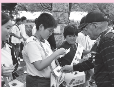
有年小学校 (田園まつり)