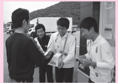
有年中学校 (ファミリーマート赤穂ちくさ川店) (ローソン赤穂西有年店)