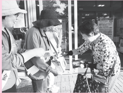
民生委員児童委員