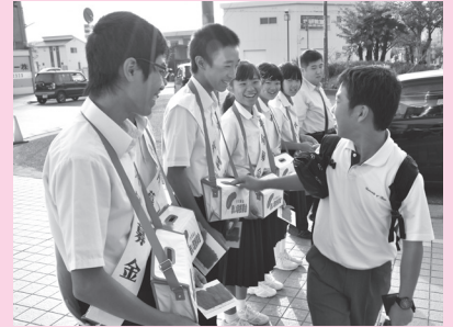
坂越中学校 (JR坂越駅)