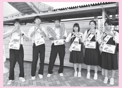
赤穂高等学校 (JR播州赤穂駅)