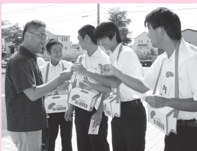
赤穂西中学校 (主婦の店塩屋店)