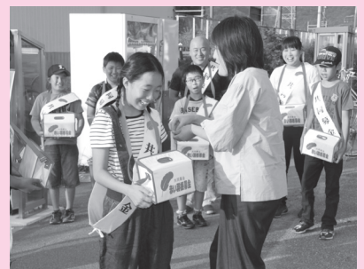
赤穂西小学校 (JR天和駅)