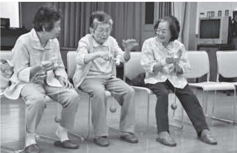
いきいきサロンにしようね