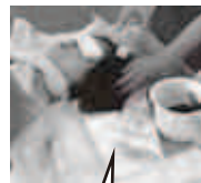
大きめの紙オムツ

少ない湯で洗髪できる。 準備・片付けが簡単。 首の負担が少なく、ベッド上 安静の方に適している。