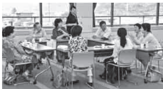
6/24 「サロン実践者交流会」の様子

サロン運営を行っている方を対象に、交流会や研修会を開催し、日頃の悩みや思いを共有する場を設けています。