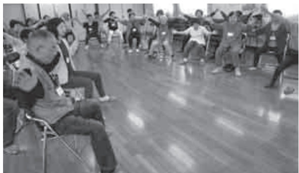
いきいきサロン千鳥