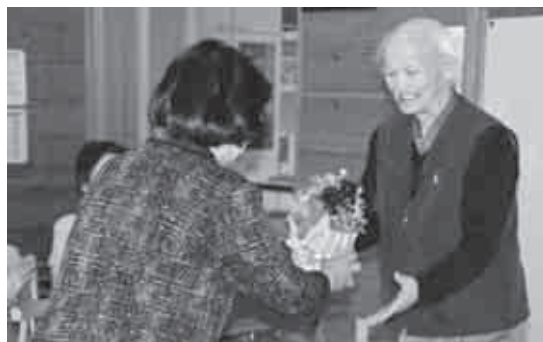
おたっしゃクラブ