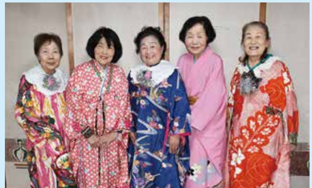
中村グループ (ボランティア活動19年)

平成17年4月にボランティアセンターに登録しています。会員は5名で、福祉施設や敬老会などで、歌や踊り、ハーモニカなどを披露しています。コロナウイルスが5類に引き下げられた令和5年度より、月1回程度福祉施設にて、日舞や新舞踊、ハーモニカ演奏を披露するなど、活動を再開しました。