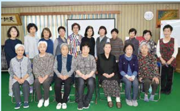
西町なかよし会 (サロン活動10年)

平成25年12月に設立し、毎月第1火曜日もしくは土曜日に、西町倶楽部にて、学習会やゲーム、季節行事などを実施しています。